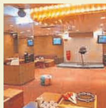
BIF カラオケ&パーティスペース マンハッタンアイランド