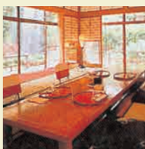
別館 料亭 聴涛館 ※聴涛館大広間はご使用の対象外となります。